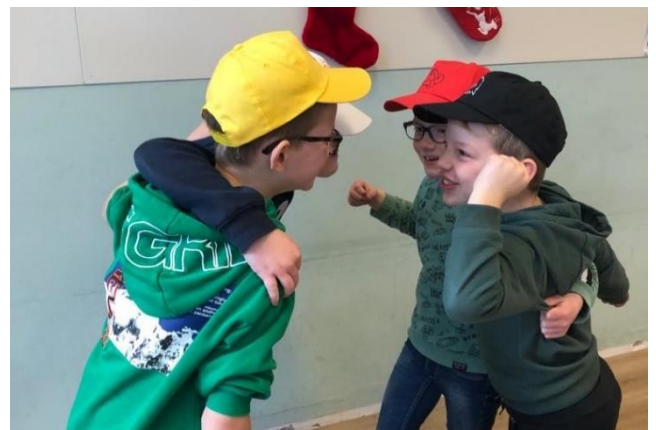
Gaat het door? Ga samen met je maatje naar de juf of meester.