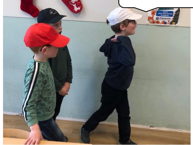
Floris gaat iets anders doen.